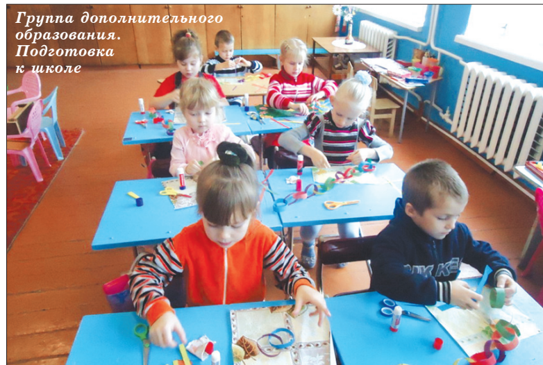
Группа дополнительного образования. Подготовка к школе

В России много школ, и у каждой свое лицо. Одни находятся в больших и шумных городах, другие в сельских глубинках. Наша школа, которой в этом году исполнилось 32 года, как раз из разряда школ сельской глубинки.