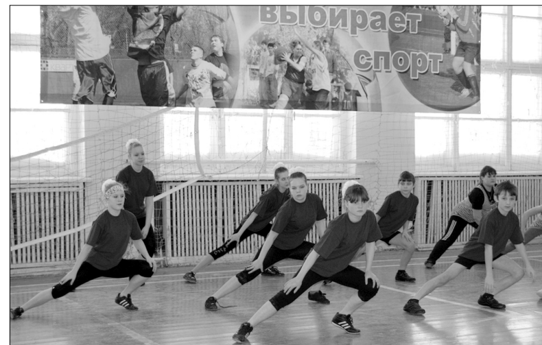
Выступление школьной команды на районном фитнес-фестивале

На базе школы проводятся занятия детской школы искусств. У нас тесное взаимодействие с Домом детского творчества г. Комсомольска. На нашей базе работает 9 детских объединений. Стабильно и творчески работают туристический клуб "Горизонт"; изостудия "Палитра", участники которой ежегодно становятся лауреатами в международном конкурсе детских рисунков "Арт-город", театральная студия на немецком языке "Сердечко" - неоднократный победитель районного праздника иностранных языков, областного фестиваля театральных миниатюр на иностранном языке "Браво". Кроме драматических постановок, ребята занимаются проектной деятельностью. Члены студии успешно участвуют в Международном конкурсе детских проектов "Встреча с Восточной Европой". Члены детского объединения "В мире муз" участвовали в Международном фестивале национальных искусств и спорта "Гармония жизни".