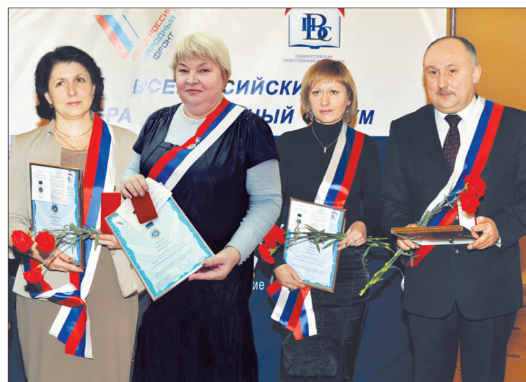
Награжденные высшей наградой ВПС - медалью «Народное признание педагогического труда»

Завершало Всероссийский образовательный форум пленарное заседание, которое проходило в историческом Императорском зале МГУ на Моховой.