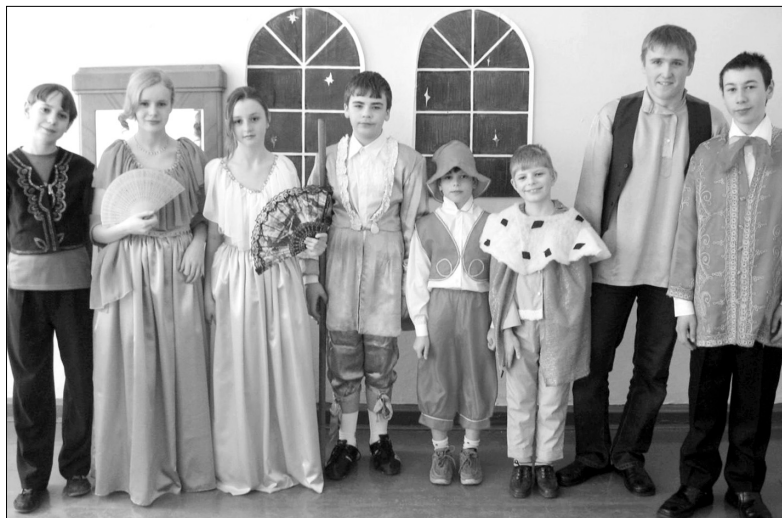
Выступление участников театральной студии «Сердечко»

На материально-техническое обеспечение нашей школы, как и многих других сельских школ, средств выделяется мало. Спонсоров в селе нет. Поэтому решили: надо попробовать заработать миллион в конкурсе ПНПО. И получилось! Пришлось нелегко: все свои проблемы учителя на время отодвинули на второй план. Современные условия в школе созданы в основном благодаря средствам, полученным в результате победы в 2008 году в федеральном конкурсе образовательных учреждений, внедряющих инновационные образовательные программы. На средства гранта оборудованы современный компьютерный класс (в школе на 1 компьютер приходится 2,5 ученика), тренажерный зал, созданы компьютеризированные рабочие места учителя в кабинетах, приобретены комплекты лабораторного и демонстрационного оборудования по физике, химии, биологии, в начальные классы. Обновлена мебель в классных комнатах. Все это делает школу современной, красивой. В школе работает сплоченный коллектив профессионалов-единомышленников из 11 педагогов.