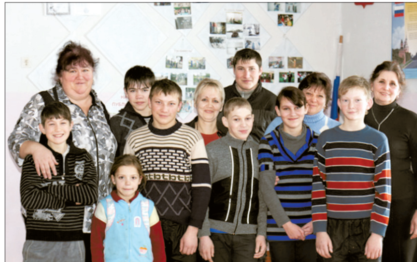
Учителя деревни Сенное Брянской области с детьми, взятыми на воспитание

Накануне Нового 2013 года, в свете принятия "Закона Димы Яковлева", который вводит запрет на усыновление российских детей гражданами США, а также в рамках Всероссийской акции Всероссийского педагогического собрания "Воспитай ребенка - сироту!" в Центре социально-консервативной политики Всероссийское педагогическое собрание провело открытую встречу с сельскими учителями России, взявшими на воспитание детей из детских домов.