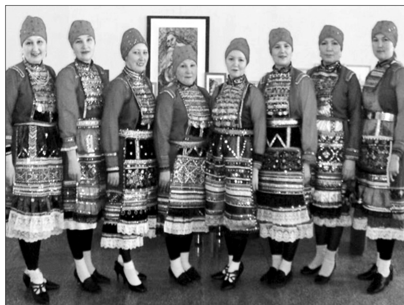
Выступает художественный коллектив на одном из праздников «День района»

В местах компактного проживания татарского и марийского