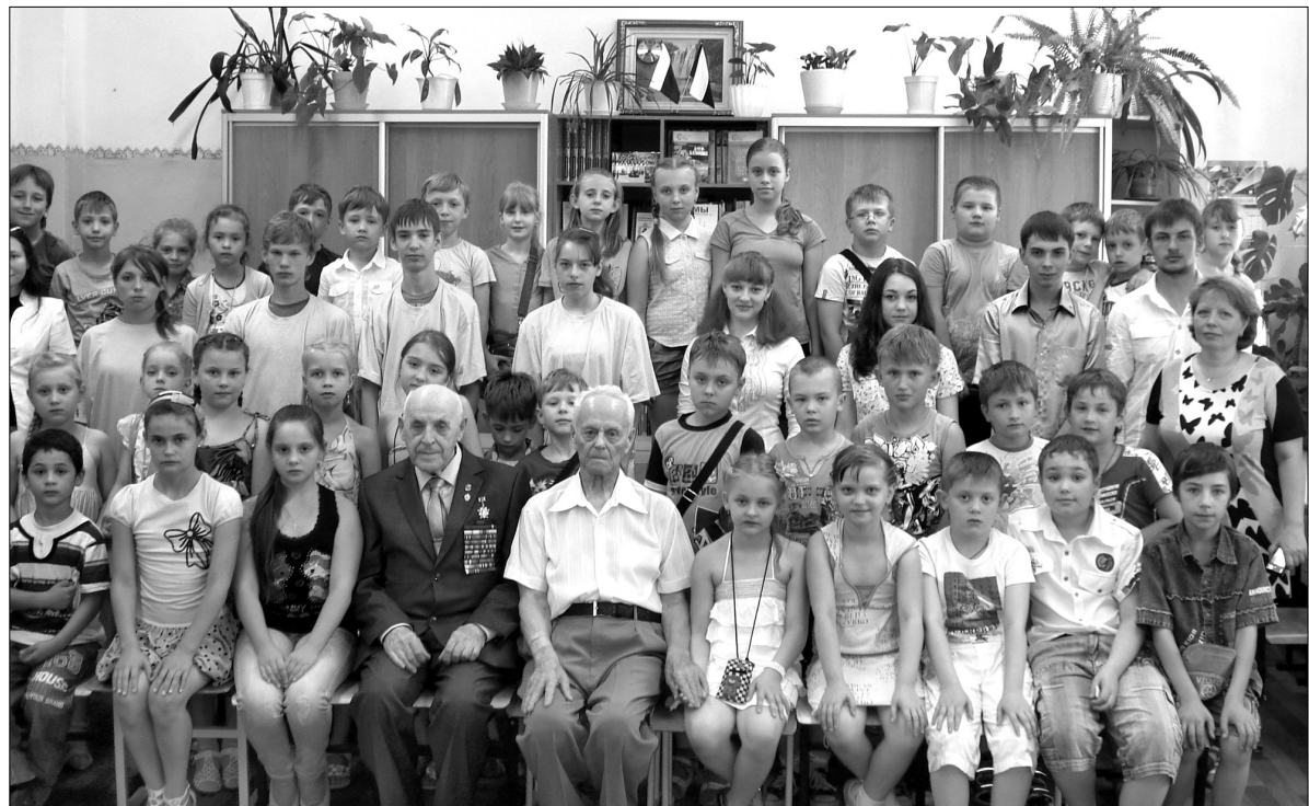
Встреча школьников с ветеранами Великой Отечественной войны