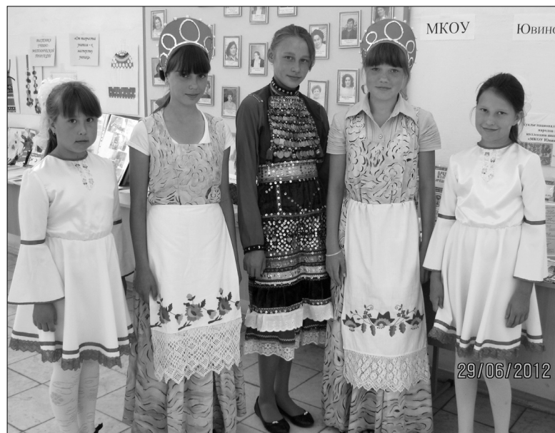
На этнокультурной ярмарке. Лето 2012 года

Однако мы не можем не отметить наличие серьезной проблемы: к сожалению, не у всех родителей и детей сформирована потребность в изучении родного языка.