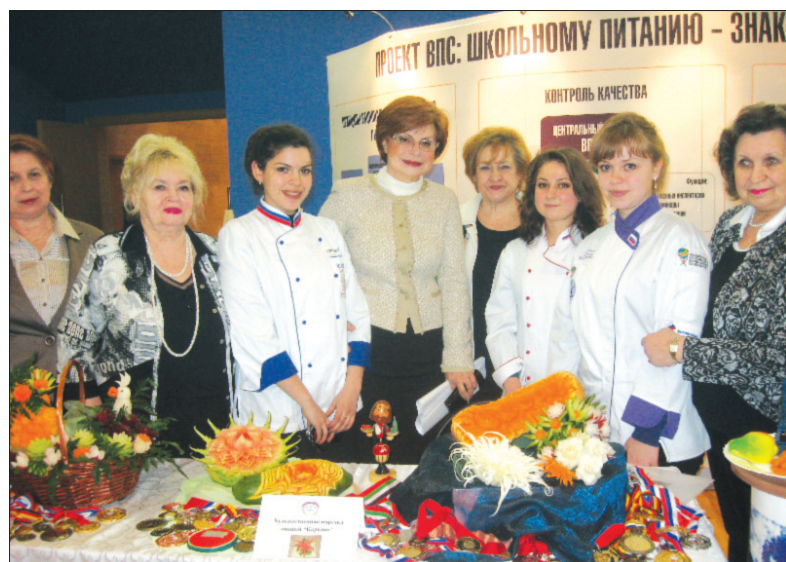
На форуме работали многочисленные выставки. На снимке: выставка, представляющая проект ВПС "Школьному питанию - знак качества"