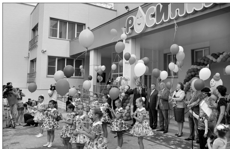
Открытие детского сада в Хабаровске

вых образовательных стандартов. На сегодняшний день каждая школа края оснащена компьютерным, спортивным оборудованием. Закуплено более тысячи единиц технологического оборудования для пищеблоков школьных столовых в Хабаровске.