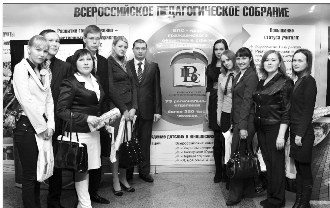
Молодые учителя - педагогическое будущее России

нии на селе требует пристального внимания, как со стороны общенациональности, так и государства. За 10 лет в России закрылась каждая третья сельская школа. Но если в деревне закрывается школа, то умирает и сама деревня. Летом 2012 года по инициативе Всероссийского педагогического собрания была создана Ассоциация учителей сельских школ, и это послужило основой для решения многих важных проблем. Учителя получили возможность общаться, обмениваться опытом, повышать свою профессиональную квалификацию. Но этого недостаточно, это только аванс на будущее. Нам нужно сделать так, чтобы в сельских школах максимально использовались дистанционные технологии, чтобы нормативы финансирования учитывались во всех регионах, чтобы были введены льготы для молодых учителей, повысился уровень заработной платы. Впереди большая работа, и здесь важно чтобы в нашу совместную с учителями деятельность вовлекалось как можно больше людей. Сегодня, когда благодаря инициативам Президента России