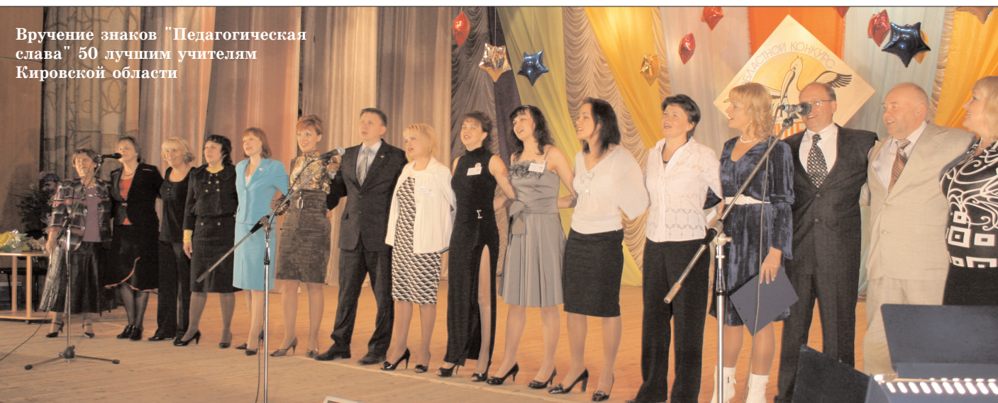
Вручение знаков "Педагогическая слава" 50 лучшим учителям Кировской области