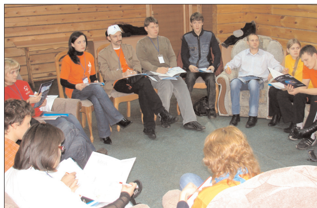
Молодые учителя обсуждают итоги очередного конкурса

Были подведены итоги работы "горячей линии", организованной Иркутским региональным отделением ВПС, куда со своими