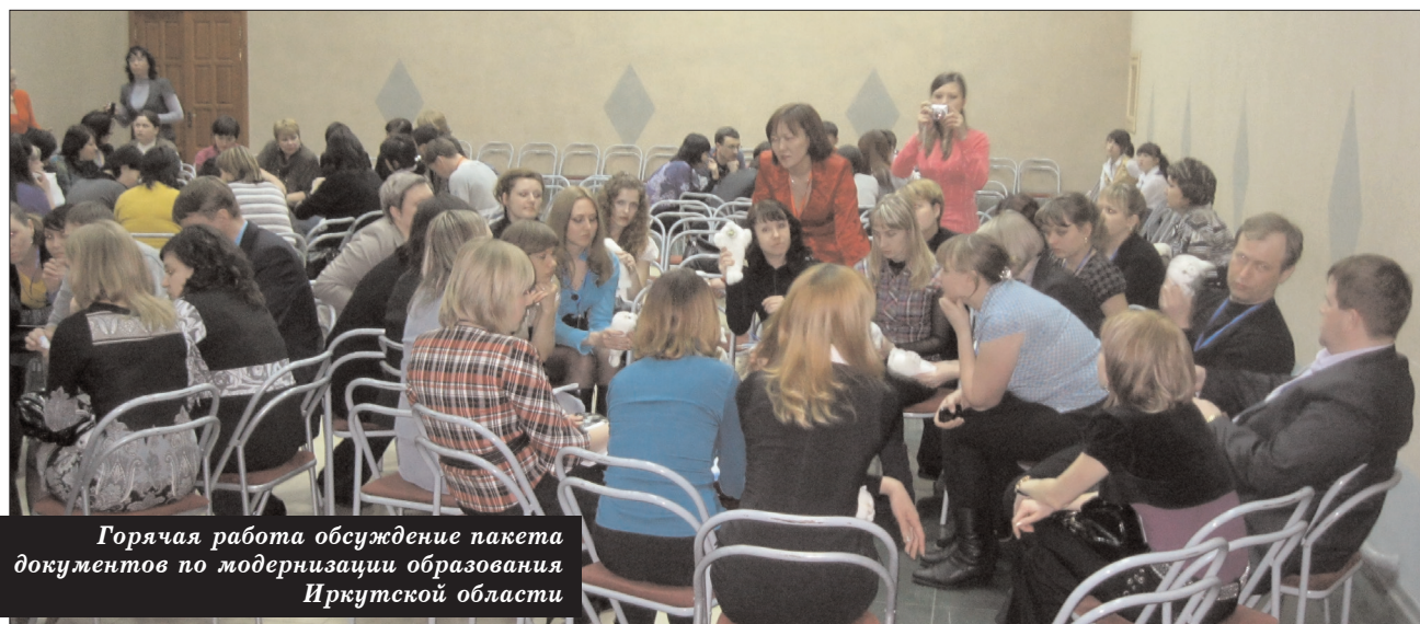
Горячая работа обсуждение пакета документов по модернизации образования Иркутской области