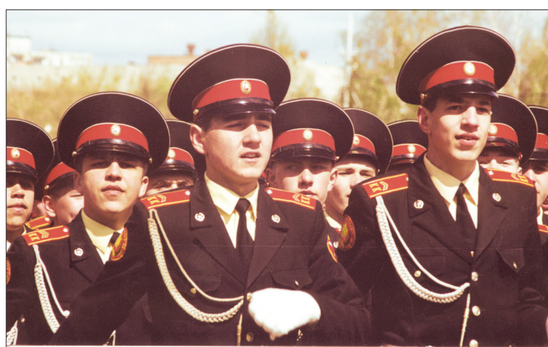
Учащиеся Норильского кадетского корпуса