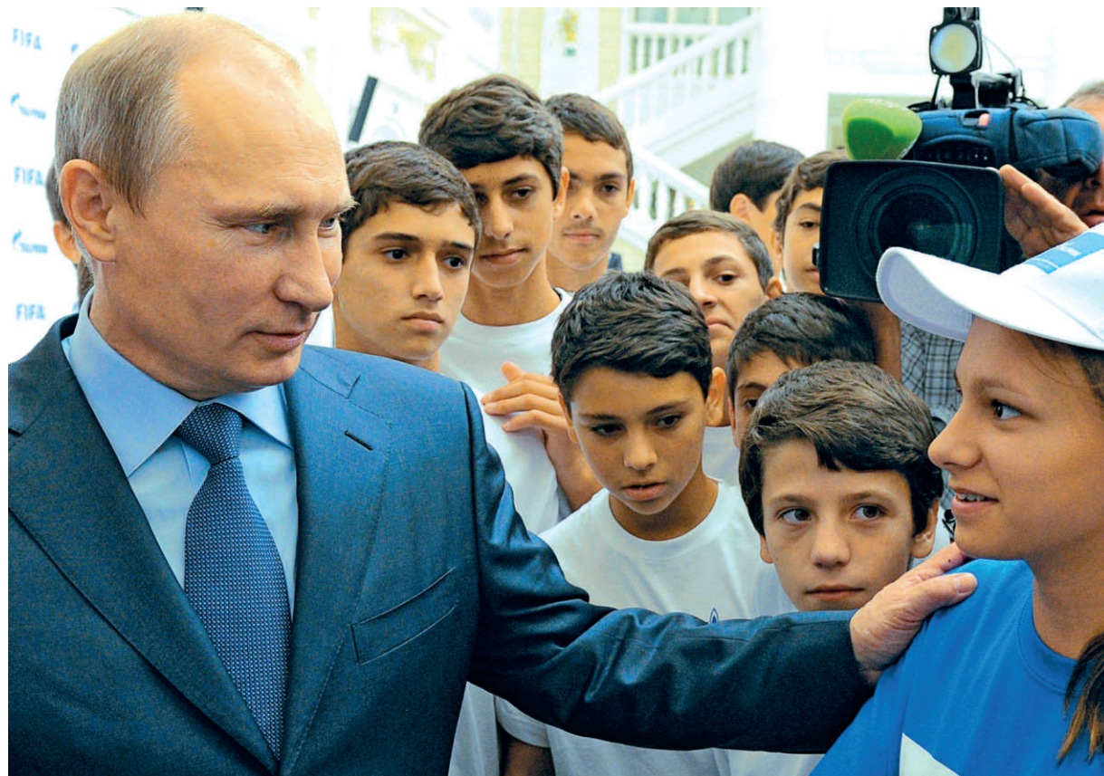
Владимир Путин во время посещения Всероссийского детского центра в Сочи. 2014 г.

« БЫТЬ НА УРОВНЕ ОЧЕНЬ СЛОЖНО. ЕСЛИ РАНЬШЕ УЧИТЕЛЬ БЫЛ, МОЖЕТ БЫТЬ, ЕДИНСТВЕННЫМ ИСТОЧНИКОМ ИНФОРМАЦИИ, ТО СЕГОДНЯ ТАКИХ ИСТОЧНИКОВ ОЧЕНЬ МНОГО, ОНИ БЬЮТ КЛЮЧОМ, ЧТО НАЗЫВАЕТСЯ. И ОСТАВАТЬСЯ НА УРОВНЕ КОНКУРЕНТОСПОСОБНОСТИ ОЧЕНЬ СЛОЖНО. ЭТО НУЖНО ДЕЙСТВИТЕЛЬНО ПРОЯВЛЯТЬ И УСЕРДИЕ, И ТВОРЧЕСКИЕ НАВЫКИ, И ТАЛАНТ. БЕЗ ЭТОГО БЫТЬ ИНТЕРЕСНЫМ СЕГОДНЯШНИМ УЧЕНИКАМ ПРАКТИЧЕСКИ НЕВОЗМОЖНО. — Президент России Владимир Путин