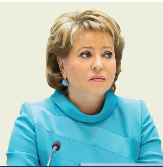
Валентина МАТВИЕНКО, председатель СФ РФ:

«Мы понимаем, что беспокоит граждан Украины — и русских, и украинцев, вообще русскоязычное население, проживающее в восточных и в южных регионах Украины. Их беспокоит беспредел. И если мы увидим, что этот беспредел начинается в восточных регионах, если люди попросят нас о помощи, а официальное обращение действующего легитимного президента у нас уже есть, то мы оставляем за собой право использовать все имеющиеся у нас средства для защиты этих граждан».