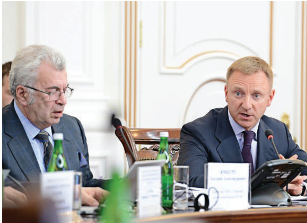
Заседание Общественного совета при Минобрнауки, 19 марта 2014 года.

Министр образования и науки России Дмитрий Ливанов о поступлении крымских выпускников в вузы