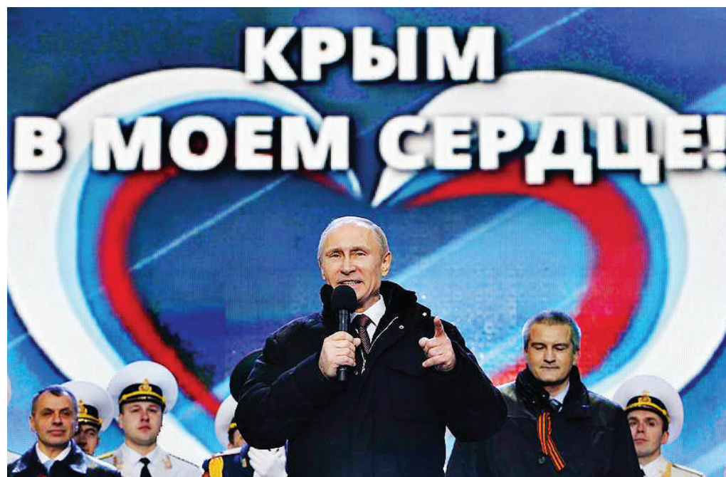
Выступление Президента России Владимира Путина на митинге-концерте «Мы вместе» в поддержку решения жителей Крыма присоединиться к России, Москва, 18 марта 2014 года.

Здесь буквально всё пронизано нашей общей историей и гордостью. В Крыму — могилы русских солдат, мужеством которых Крым в 1783 году был взят под Российскую державу. Крым — это Севастополь, город-легенда, город великой судьбы, город-крепость и Родина русского черноморского военного флота. Крым — это Малахов курган и Сапун-гора. Каждое из