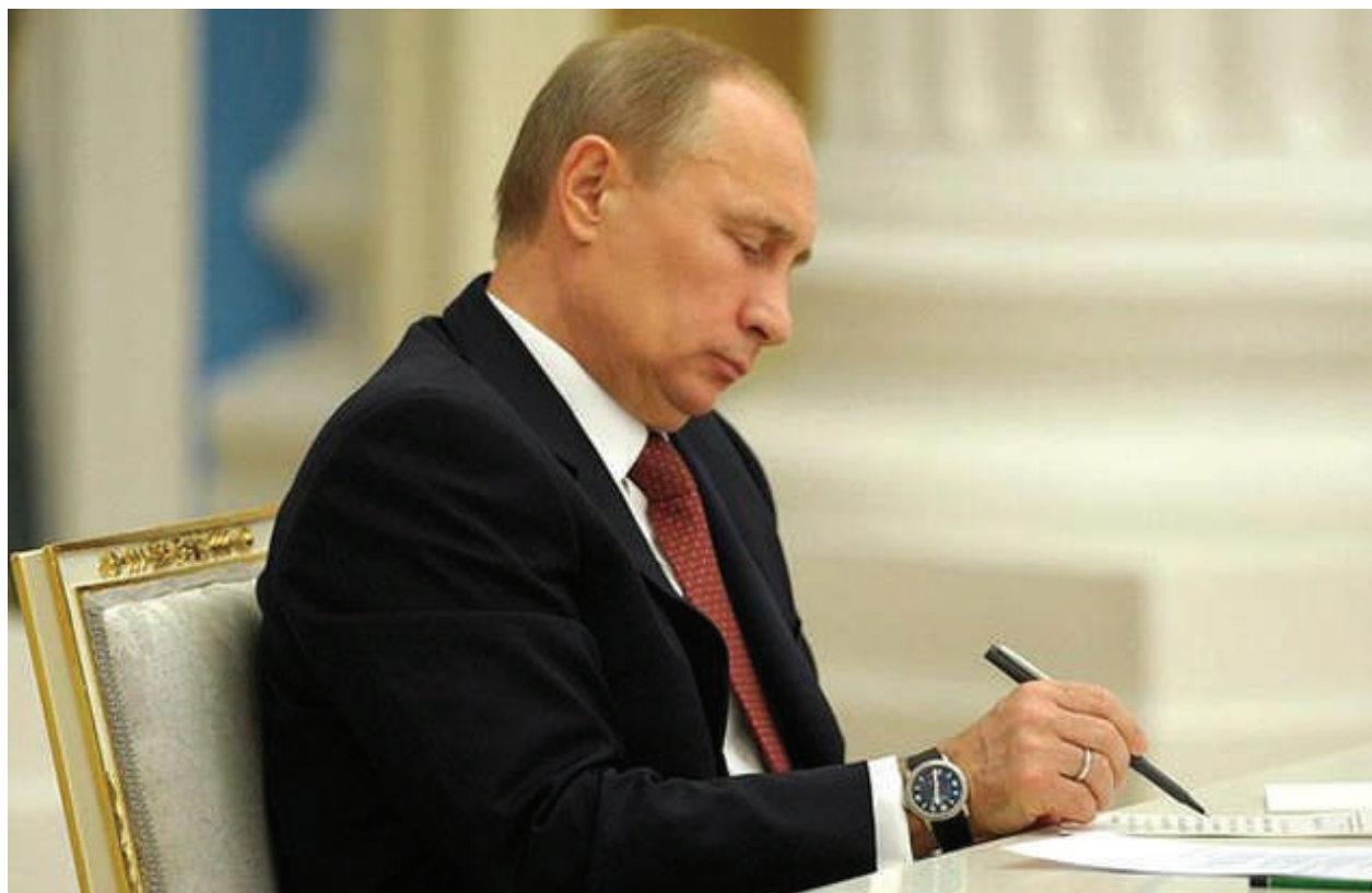
Президент РФ Владимир Путин подписал закон о регулировании образования в Крыму и Севастополе 5 мая 2014 года.

«Я думаю, что до конца года наши общие затраты на модернизацию системы образования Крыма — это и школа, и дошкольное