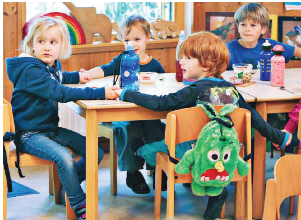
В образовательные результаты помимо знаний основных фактов и сведений из разного рода дисциплин, теперь входят навыки коммуникации, взаимодействия и коллективной работы.

Результаты оценки нового качества образования влияют на образовательную политику. На их основе разрабатываются рекомендации образовательным организациям по совершенствованию образовательных методов и программ. Уже сейчас анализируются успехи наиболее результативно работающих коллективов, вносятся изменения в действующие федеральные государственные образовательные программы и примерные основные образовательные программы.