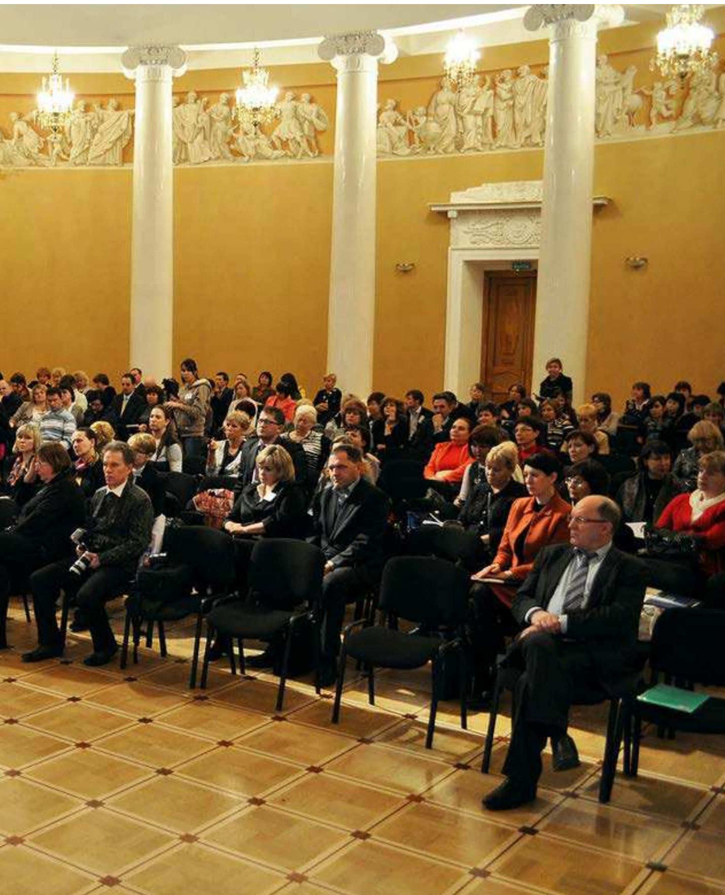
ФОТО: ВСЕРОССИЙСКИЙ ОБРАЗОВАТЕЛЬНЫЙ ФОРУМ "ОБЩЕСТВЕННО-ПРОФЕССИОНАЛЬНАЯ ОЦЕНКА КАЧЕСТВА ОБРАЗОВАНИЯ В НОВЫХ ЗАКОНОДАТЕЛЬНЫХ УСЛОВИЯХ: ОПЫТ ГОРОДА МОСКВЫ". 18 ДЕКАБРЯ 2012 ГОДА