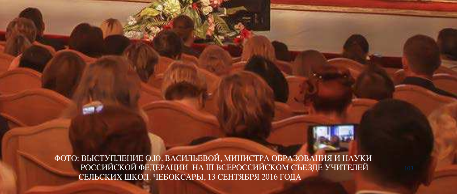
ФОТО: ВЫСТУПЛЕНИЕ О.Ю. ВАСИЛЬЕВОЙ, МИНИСТРА ОБРАЗОВАНИЯ И НАУКИ РОССИЙСКОЙ ФЕДЕРАЦИИ НА III ВСЕРОССИЙСКОМ СЪЕЗДЕ УЧИТЕЛЕЙ СЕЛЬСКИХ ШКОЛ. ЧЕБОКСАРЫ, 13 СЕНТЯБРЯ 2016 ГОДА