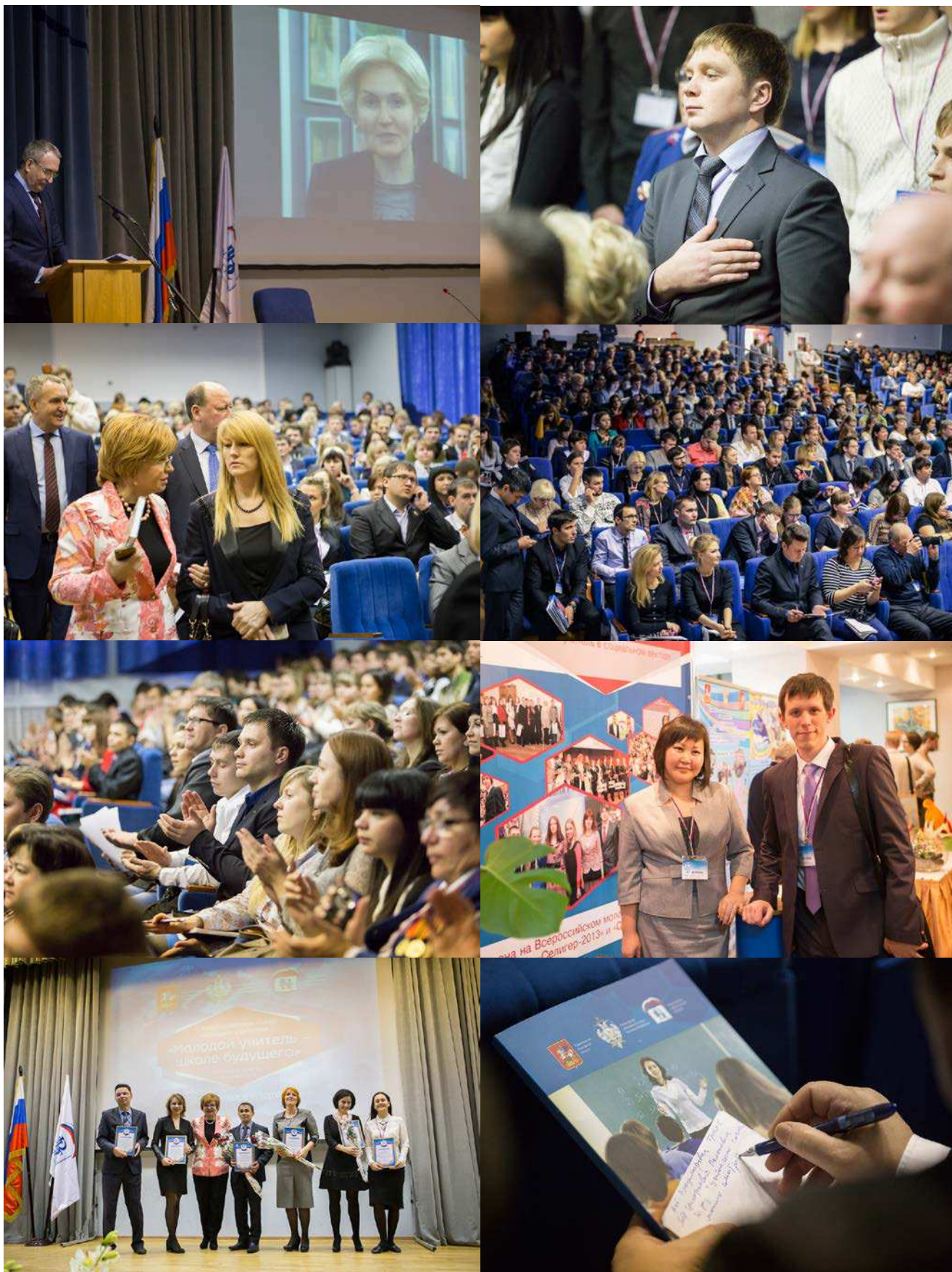
ФОТО: ДЕЛЕГАТЫ ВТОРОГО СЪЕЗДА МОЛОДЫХ УЧИТЕЛЕЙ "МОЛОДОЙ УЧИТЕЛЬ – ШКОЛЕ БУДУЩЕГО". ЭЛЕКТРОСТАЛЬ, 4-6 ДЕКАБРЯ 2014 ГОДА