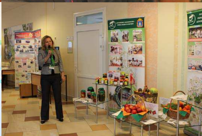
ФОТО: II ВСЕРОССИЙСКИЙ СЪЕЗД СЕЛЬСКИХ УЧИТЕЛЕЙ «СЕЛЬСКАЯ ШКОЛА В РОССИИ: КАЧЕСТВО, ДОСТУПНОСТЬ, ПРОФЕССИОНАЛИЗМ». ТАМБОВ, 17–19 НОЯБРЯ 2014 ГОДА