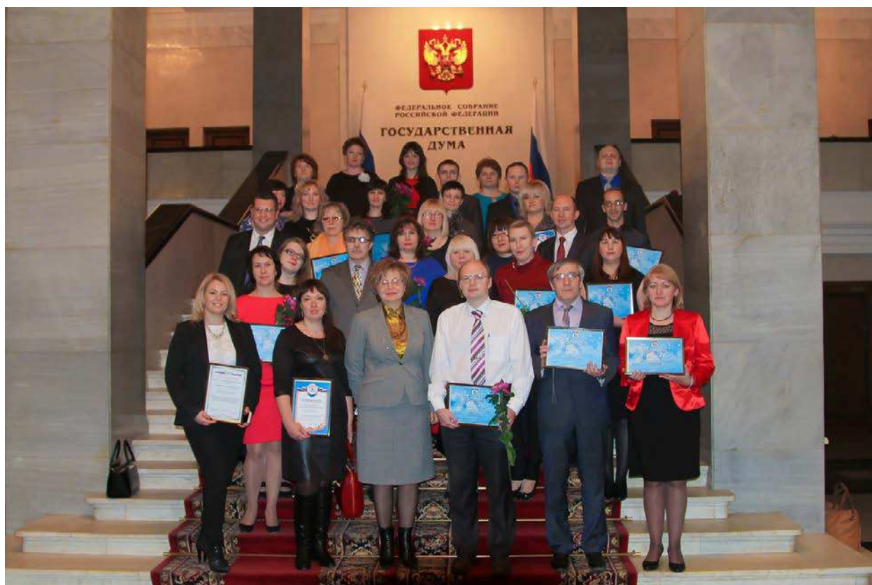
ФОТО: НАГРАЖДЕНИЕ ПОБЕДИТЕЛЕЙ КОНКУРСА «МОИ ИННОВАЦИИ В ОБРАЗОВАНИИ». МОСКВА, ГОСУДАРСТВЕННАЯ ДУМА, 28 ДЕКАБРЯ 2015 ГОДА