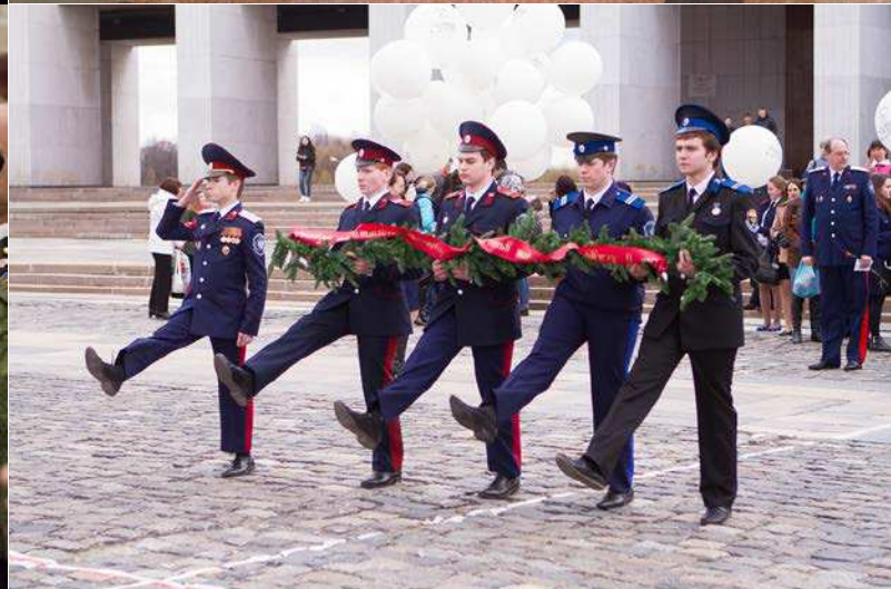
ФОТО: МЕЖДУНАРОДНЫЙ КОНГРЕСС УЧИТЕЛЕЙ "УЧИТЕЛЬ ПОБЕДЫ ЗА ДЕТСТВО БЕЗ ФАШИЗМА". ЦЕНТРАЛЬНЫЙ МУЗЕЙ ВЕЛИКОЙ ОТЕЧЕСТВЕННОЙ ВОЙНЫ 1941–1945 ГГ., МОСКВА, ПОКЛОННАЯ ГОРА, 22 АПРЕЛЯ 2015 ГОДА