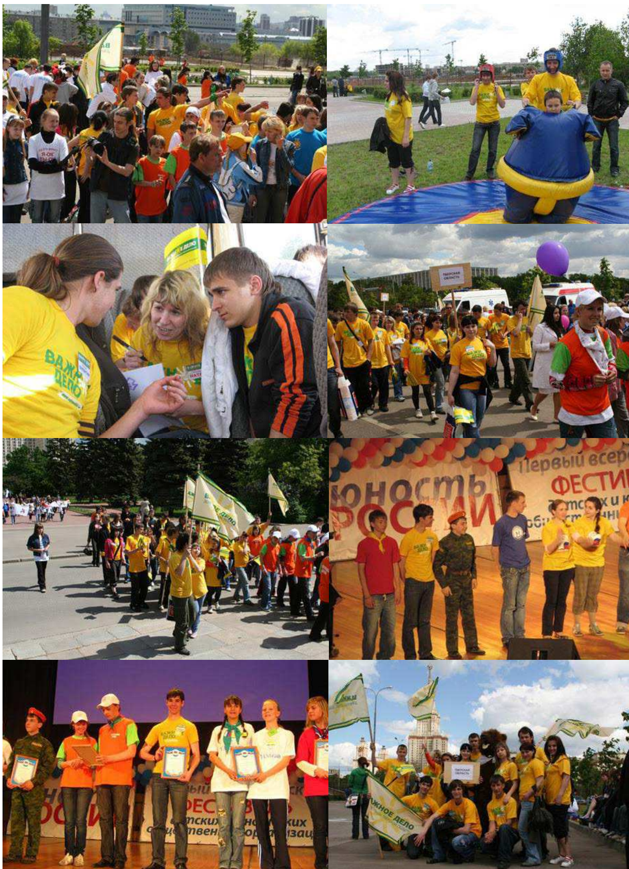
ФОТО: ПЕРВЫЙ ВСЕРОССИЙСКИЙ ФЕСТИВАЛЬ ДЕТСКИХ И ЮНОШЕСКИХ ОБЩЕСТВЕННЫХ ОРГАНИЗАЦИЙ "ЮНОСТЬ РОССИИ". МОСКВА, 30 МАЯ 2008 ГОДА