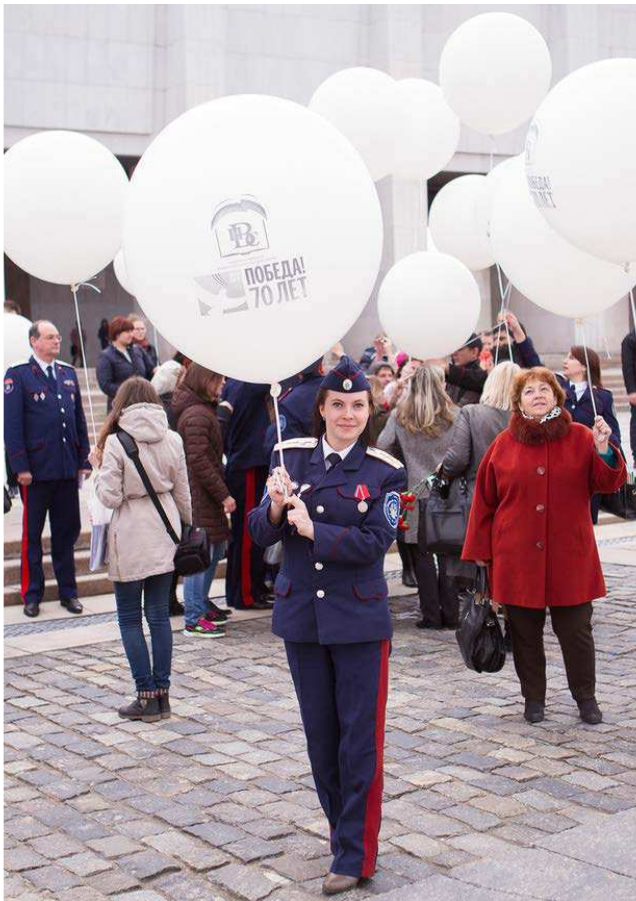
ФОТО: МЕЖДУНАРОДНЫЙ КОНГРЕСС УЧИТЕЛЕЙ "УЧИТЕЛЬ ПОБЕДЫ ЗА ДЕТСТВО БЕЗ ФАШИЗМА". ЦЕНТРАЛЬНЫЙ МУЗЕЙ ВЕЛИКОЙ ОТЕЧЕСТВЕННОЙ ВОЙНЫ 1941–1945 ГГ., МОСКВА, ПОКЛОННАЯ ГОРА, 22 АПРЕЛЯ 2015 ГОДА