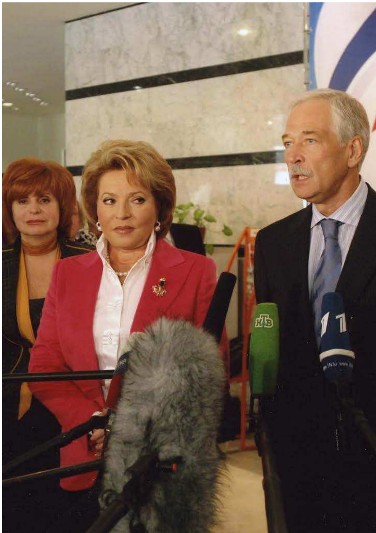
ФОТО: II СЪЕЗД ВСЕРОССИЙСКОГО ПЕДАГОГИЧЕСКОГО СОБРАНИЯ «МОЛОДОЕ ПОКОЛЕНИЕ В ЦЕНТРЕ ВНИМАНИЯ ОБРАЗОВАНИЯ». САНКТ-ПЕТЕРБУРГ, 25 СЕНТЯБРЯ 2007 ГОДА