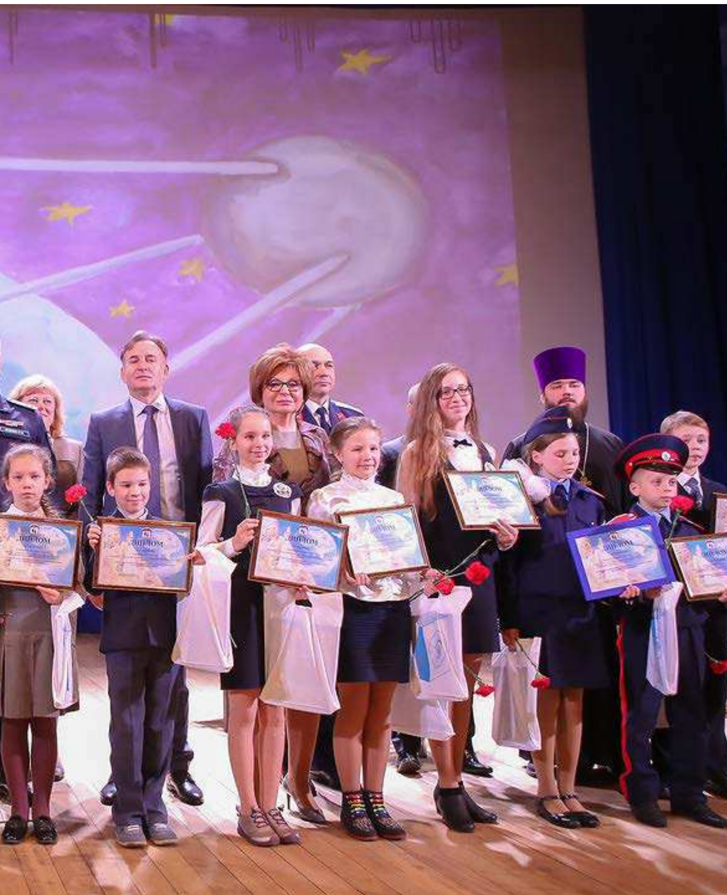
ФОТО: ФОРУМ "УЧИТЕЛЯ И РОДИТЕЛИ ЗА ПАТРИОТИЧЕСКОЕ ВОСПИТАНИЕ ШКОЛЬНИКОВ". МОСКВА, 17 МАЯ 2016 ГОДА