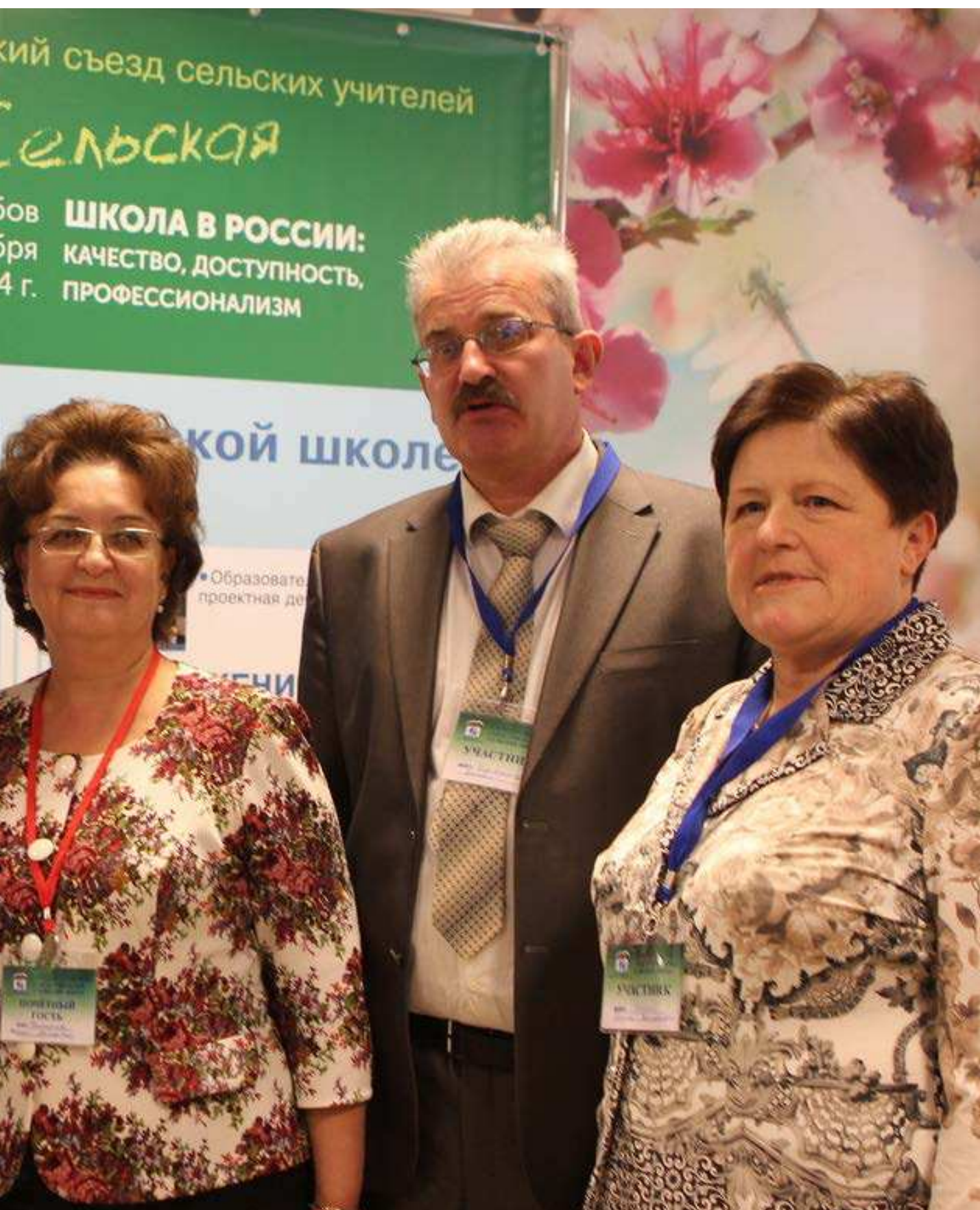
ФОТО: ДЕЛЕГАТЫ II ВСЕРОССИЙСКОГО СЪЕЗДА СЕЛЬСКИХ УЧИТЕЛЕЙ «СЕЛЬСКАЯ ШКОЛА В РОССИИ: КАЧЕСТВО, ДОСТУПНОСТЬ, ПРОФЕССИОНАЛИЗМ». ТАМБОВ, 17–19 НОЯБРЯ 2014 ГОДАА 81