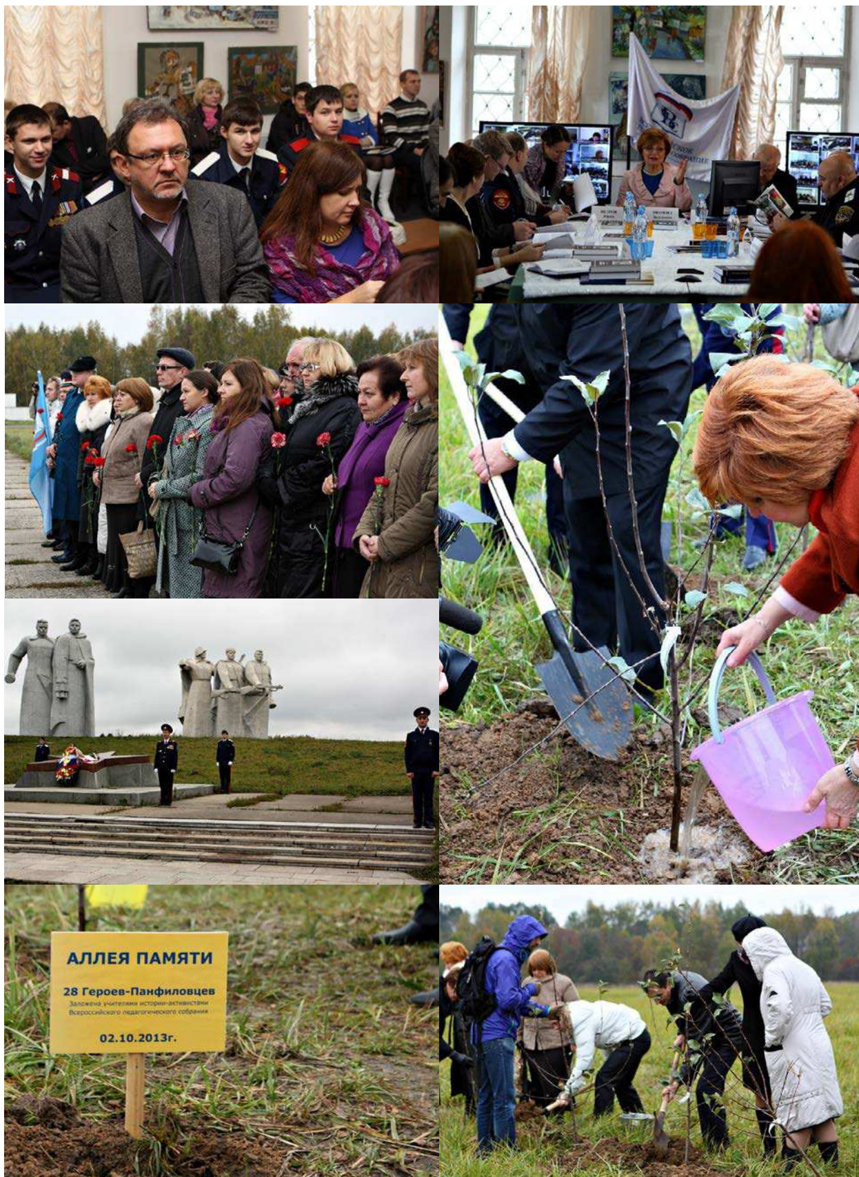
ФОТО: ВСЕРОССИЙСКАЯ ВИДЕОКОНФЕРЕНЦИЯ «ИСТОРИКО-КУЛЬТУРНЫЙ СТАНДАРТ ГЛАЗАМИ РОССИЙСКОГО УЧИТЕЛЯ». ВОЛОКОЛАМСК, МОСКОВСКАЯ ОБЛАСТЬ, 2 ОКТЯБРЯ 2013 ГОДА. УЧАСТНИКИ АКЦИИ В ВОЛОКОЛАМСКЕ ЗАЛОЖИЛИ АЛЛЕЮ ПАМЯТИ 28 ГЕРОЕВ-ПАНФИЛОВЦЕВ У РАЗЪЕЗДА ДУБОСЕКОВО