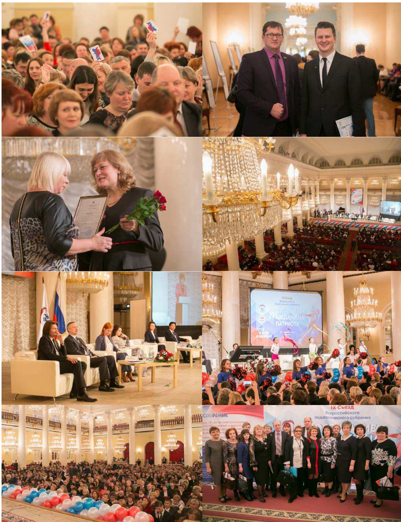
ФОТО: ІХ СЪЕЗД ВПС "ВОСПИТАНИЕ ГРАЖДАНИНА И ПАТРИОТА". МОСКВА, 16 ДЕКАБРЯ 2015 ГОДА