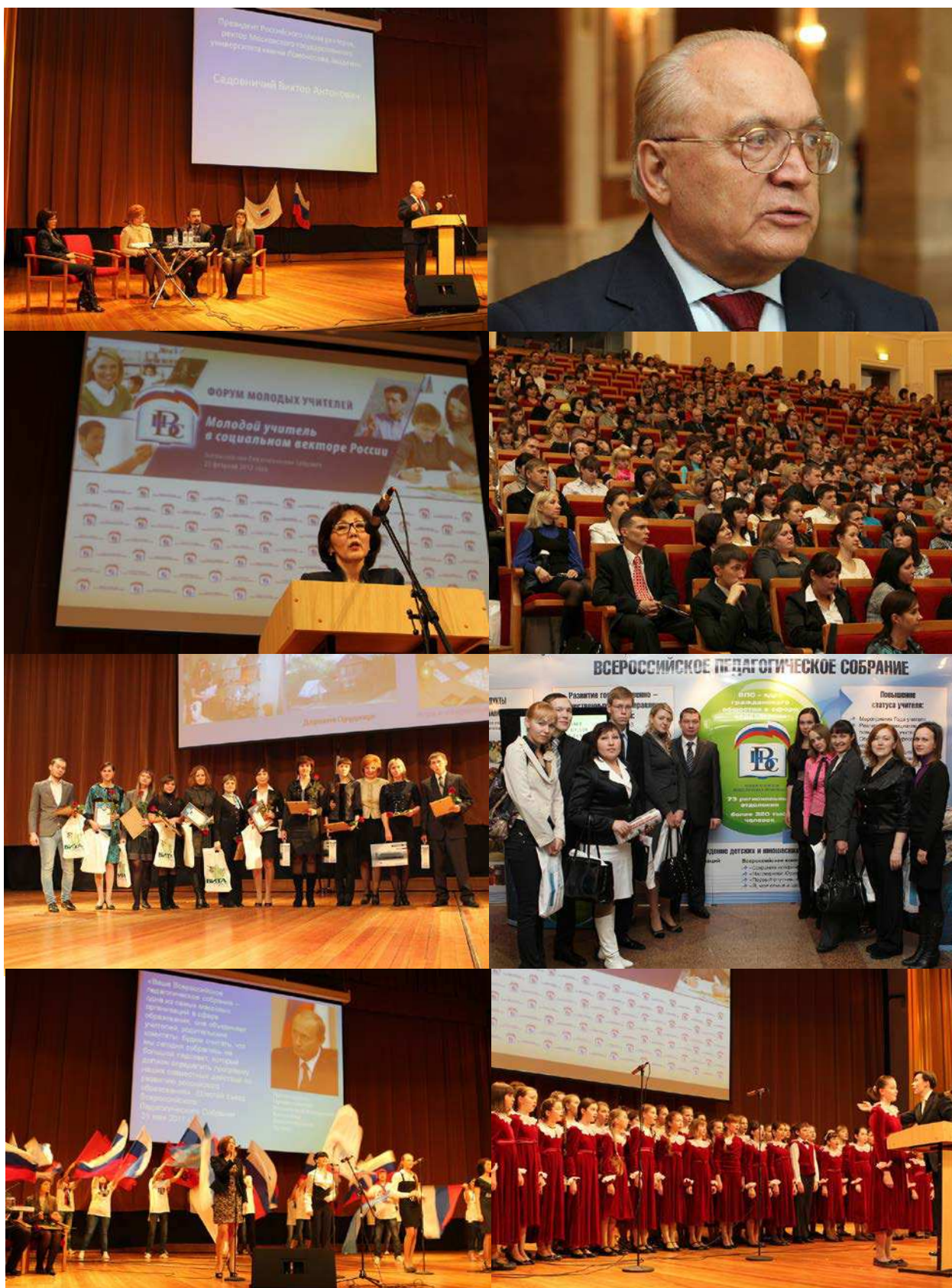
ФОТО: ОТКРЫТЫЙ ВИДЕОФОРУМ МОЛОДЫХ УЧИТЕЛЕЙ "МОЛОДОЙ УЧИТЕЛЬ В СОЦИАЛЬНОМ ВЕКТОРЕ РОССИИ". 22 ФЕВРАЛЯ 2012 ГОДА