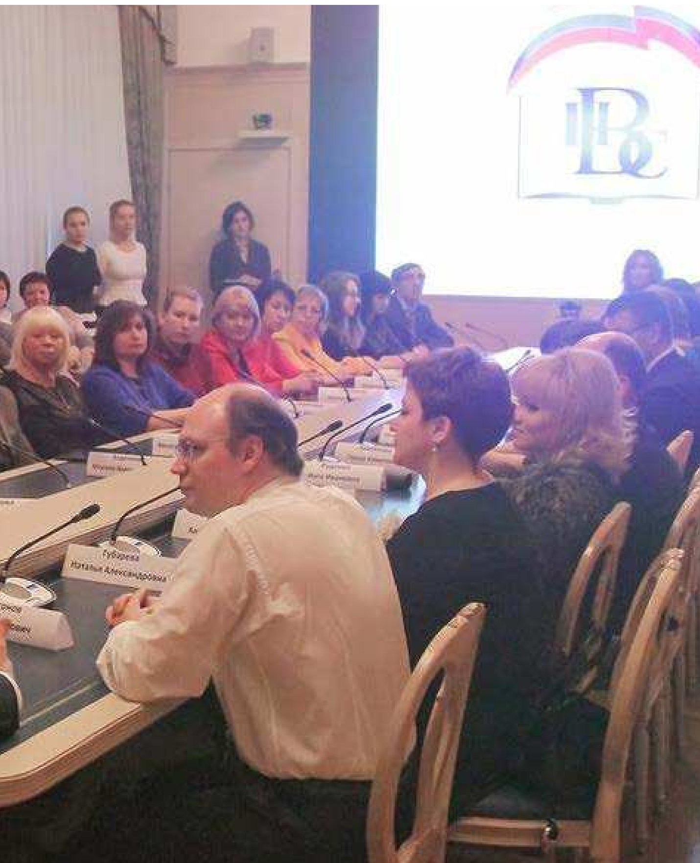
ФОТО: НАГРАЖДЕНИЕ ПОБЕДИТЕЛЕЙ КОНКУРСА «МОИ ИННОВАЦИИ В ОБРАЗОВАНИИ». МОСКВА, ГОСУДАРСТВЕННАЯ ДУМА, 28 ДЕКАБРЯ 2015 ГОДА