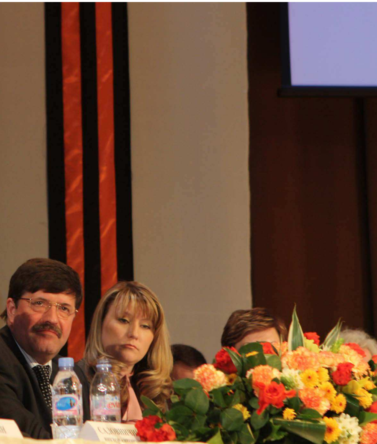
ФОТО: I МОСКОВСКИЙ МЕЖДУНАРОДНЫЙ КОНГРЕСС УЧИТЕЛЕЙ. 27 АПРЕЛЯ 2010 ГОДА